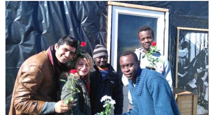
Dans la jungle de Calais

« Je suis Zahar je viens du Darfour est-ce qu'elle se mange la fleur ? / Je suis Nazari je viens de Téhéran j'ai mis un an et un mois pour arriver. The beauty is dead La beauté est morte ils ferment la réalité où aller ? / Je m'appelle Antoine je vais exploser ce putain de mur NO BORDER go ! / Je suis perdue / entre une route et une autoroute / Entre les grillages et les grilles / Entre mes ranjos et mes jonquilles. »